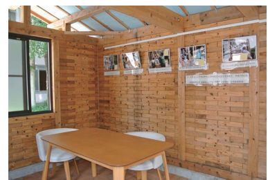
10 床も壁も木材仕上げ 壁には子ども達の頑張り展示