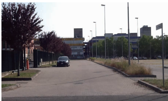
マジェネス通り（右奥の建物全てが数学科）

ではよく見かけますが、数学科のキャンパスに続く新しい通りに先生の名前が付けられており驚きました。