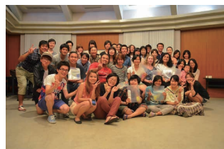
お疲れ様パーティー

たった1年間の留学生活でしたが、濃い1年間でした。京から学んだことや体験したことを生かして、エジプト帰国後も積極的にいろいろなイベントに参加して、京都でエジプトの紹介をしていたように、今度はエジプトの皆に京都の素晴らしさを知ってほしいです。