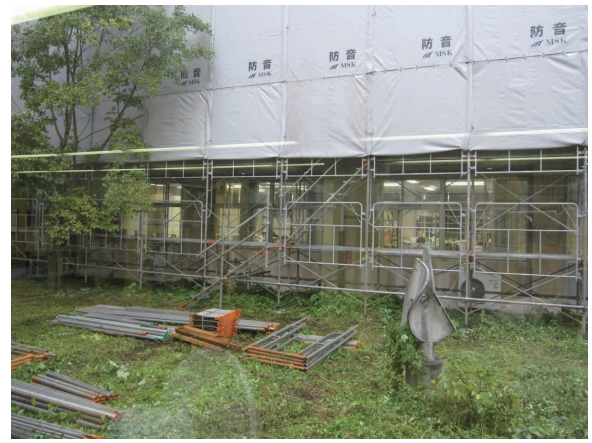
事務室（1階）の上が工事現場

いざ工事というときになって、ありがちなこととは言え、諸般の理由で施工が1ヶ月遅れました。当初の計画では、まず西館を完成させて、そこに事務室や開架図書を移して、既存の北館・南館の工事にかかる予定でした。しかし最終的な竣工予定をまもるため、居ながらにして工事という事態に陥りました。利用スペースがほぼ半減し、壁一枚隔てたところが工事現場