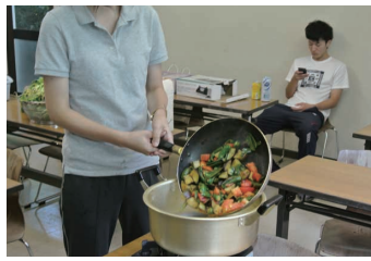
4 採れたての野菜を炒める よい香り

の実践」をするために、学生は収穫物を教室に持って入り、すぐに調理して食べます（写真4、5）。野菜が嫌いだったのに、自分の栽培した野菜は食べられるようになる学生もいます。また、冬に有機物を大量に畑に施用することで、同じ種類や近縁種の野菜を同じ場所で続けて栽培すると作物の生育が不良となり収穫できなくなる、いわゆる連作障害が生じにくくなります。このことは、栽培畑が限られた面積しかなく、同種や近縁の実習題材（作物）を繰り返し栽培しなければならない学校農園では大いに意義あることです。本学の学生には、この実習で学習したことを、赴任校での栽培の授業に、ぜひ役立てて欲しいものです。