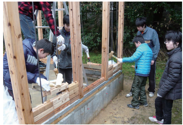
6 みんなでつみきを積んでいく 最初は慎重に

平成24年1月に、基礎の上に土台を載せることから始めました。ハウス作りに携わったのは附属桃山小学校の児童7名と附属桃山中学校の生徒3名、産業技術科学科の学生2名および桃小の保護者と教員各1名、それに私の計15名です。最初は失敗が続きもた