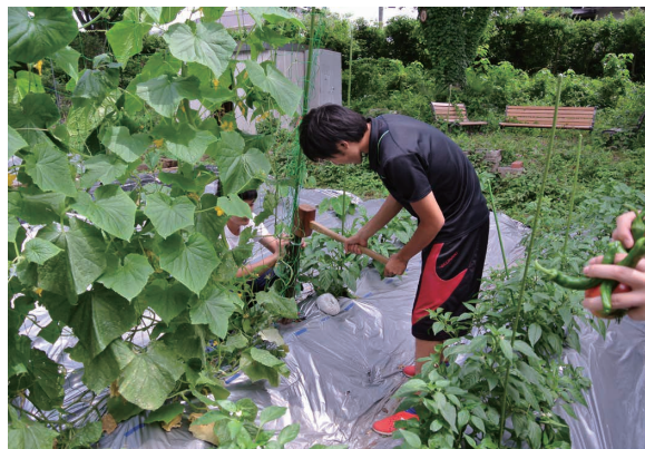
1 キュウリのネット用杭を打つ 汗がしたたる

私は、大阪教育大学で非常勤講師として栽培の実習授業を担当しており、そこで20年以上、無化学肥料・無農薬の栽培を続けてきました。この栽培法のノウハウは熟知しているつもりです。これを本学でも再現を試みることにしました。まずは実習に十分な広さの栽培農地の確保、すなわち拓殖実習から始めました。橋本先生がかつて使われていた5m四方の狭い畑の西側