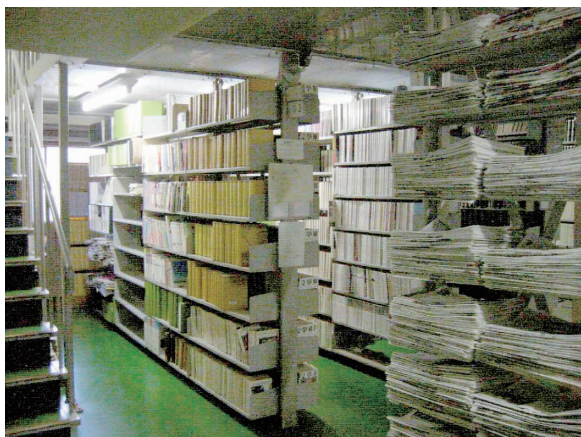
増改修前の旧図書館・書庫

利用者の推移を統計でみると、1998年（平成10年）度の入館者数は103,000人、貸出冊数は学生16,405冊（1人当たり7.53冊）。まだ冷房が入るのは一部の教室のみで、学生が図書館へ涼をもとめてやってくる時代でした。改修直前の2011年（平成23年）度入館者数は64,700人、貸出冊数は学生19,637冊（1人当たり10.4冊）と、貸出冊数は微増しましたが、入館者数は大きく減りました。なにしろ冷房が入る教室は当たり前、携帯電話で図書目録もデータベースも検索でき、日本語の文献も一部はオンラインで読める時代です。「図書館に来なくてはできないこと」は、確実に変化していきました。