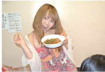
5 野菜カレーにして食べる 美味しくて幸せ