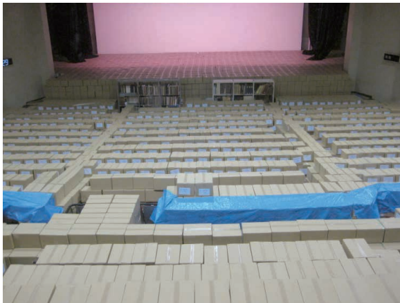
立錐の余地もなく講堂に積まれた段ボール箱

毎日、職員は図書を保管するダンボール箱のサイズを考え、メジャーを持って館内の物品を測りました。学内各所をお願いをして確保した保管場所にも足を運び、物がちゃんと収まるかどうか計測しました。