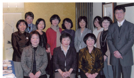
私にとっての第一期生の皆さんが藤堂音楽賞受賞をお祝いして下さいました。

紙幅が尽きて書けなくなってしまいましたが、京都教育大学から離れてみると、当たり前と思っていたことが実はとても恵まれたことであったということにいろいろと気付かされます。最後になりましたが、この大切な大学の発展を心から願っております。