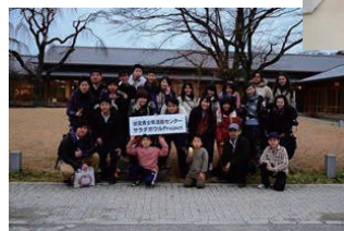
サラダボウル宿泊プログラム