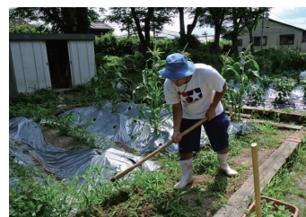
2 中耕除草（耕して草を取る） 腰が痛い

の地に敷かれていた舗装用プレートを撤去し、そこに土を入れ、その下の土とともに耕して枯葉や米ぬかなどの有機物を大量に施用し、その周りをついてJRが使用した枕木で囲みました。現在、畑地は西側の民家近くまで拡張していません。畑の南側には大きなケヤキの木が植わっていますが、そ