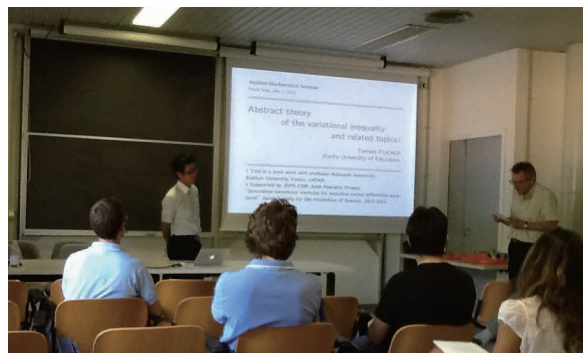
パヴィア大学応用数学セミナーにて

今回の滞在では日本とイタリア間の二国間交流事業の支援を受け、私の最近の研究成果を発表すること、共同研究に向けて議論を行うことが主な目的で、滞在期間中の朝から晩まで数学漬けの環境を頂くことができました。おかげでこれまでの抽象理論を応用した新しい研究を共同研究として進めていく計画を立てることができました。