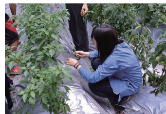
3 伏見甘長トウガラシの収穫 美味しそう

の周辺には鳥が運んだ種子から生えた雑多な樹木が長年の間に大きく繁茂し、畑地を暗くし風通しも悪くなっていました。これらの木を伐採する開拓を続けた数年間、学生諸君は過酷な肉体労働にもかかわらず、文句を言ったのは半数程度で、むしろ楽しそうに開拓を続けてくれました。おかげで畑地の周囲は明るく、風も通り乾燥して、作物の生育が良くなると同時に、それまで大量に発生していた蚊が激減しました。現在、開拓地は畑らしくなり、学生諸君は学校の栽培園を模した作物栽培の実習に、汗を流しています（写真1～3）。