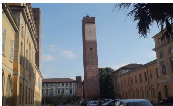
パヴィア大学 文系キャンパス内

ウィキペディアには上の写真の建物が大学として紹介されており、確かに見間違えるほど歴史ある立派な建物ですが、これは学生寮です。