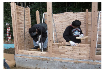
7 だいぶ慣れてきた もう1人で積めるよ

出る頃には、これは本学唯一の木造手作りハウスとして供用されていることでしょうか。完成までにやたらと時間が掛かり、当初の目的とは異なりましたが、このハウスが学生諸君らの気分転換、憩いの場として利用され、京教大の名所の一つとなることを、願っています。