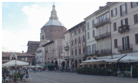
ヴィットリア広場と教会

パヴィアはイタリア北部の歴史ある街で、街の中心にはシンボルの教会（ドゥオモ）やヴィットリア広場があり、南にはティチーノ川が流れ、屋根付きのコペルト橋が架かっています。まさに街のど真ん中にパヴィア大学のキャンパスもあるのですが、そこは文系のキャンパスで、数学科のある理系キャンパスは街の郊外にあります。以前は広大な畑だった所に新しく大学の宿泊施設や学食が建設されていました。大学関係者用のプールやジム、保育施設など充実した環境が印象的です。私はその宿泊施設に滞在させてもらうことになりました。