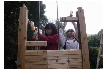
8 女の子も脚立に上って力仕事 木槌の使い方もお手の物