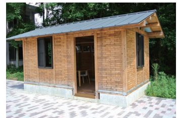
9 入り口を除いて完成 山小屋の風格